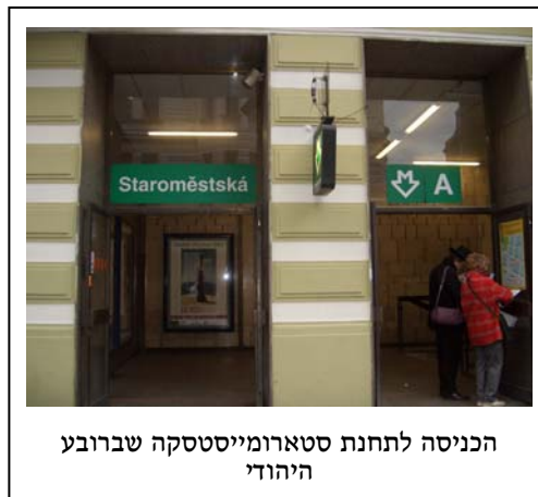
הכניסה לתחנת סטארומייסטסקה שברובע היהודי

זכרו: תחנת המטרו הנמצאת ברובע היהודי היא תחנת סטארומייסטסקה (Staroměstská) שבמטרו A – הקו הירוק.