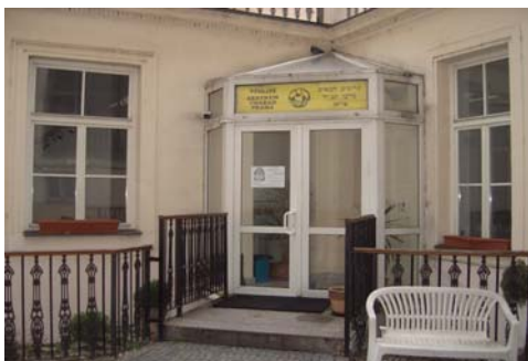
מרכז חב"ד פראג – רח' פריז'סקה 3 מימין – דלת הכניסה לבניין מהרחוב. משמאל – הכניסה לבית חב"ד עצמו.