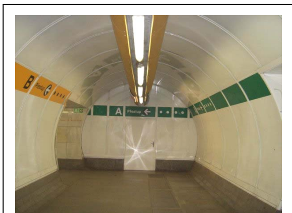
תחנת המטרו מוסטק. נווטו לפי הפסים שעל הקירות. הפס הירוק – מטרו A, הפס הצהוב – מטרו B.

לאחר שעליתם במדרגות, לכו לאורך הקירות המסומנים בפס ירוק, בכיוון החיצים, כדי להגיע לרציף של הקו הירוק – מטרו A. בהגיעכם לרציף, שימו לב לעלות על הרכבת הנמצאת ברציף 2, הנוסעת לכיוון התחנה הסופית דייביצקה (Dejvická) – כמובן ממפת המטרו שבעמוד הקודם – ולרדת בתחנה הראשונה, תחנת סטארומיסטסקה (Staroměstská).