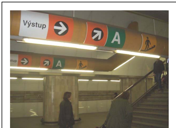
תחנת המטרו מוסטק. שימו לב לשילוט המורה על המדרגות המוליכות לכיוון הרציף של מטרו A בירוק

בצבע ירוק, מטרו B מסומן תמיד בצבע צהוב ומטרו C מסומן תמיד בצבע אדום. לכו לפי הסימונים והצבעים עד שתגיעו לרציף שאליו ברצונכם לעבור.