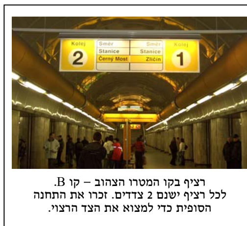
רציף בקו המטרו הצהוב – קו B. לכל רציף ישנם 2 צדדים. זכרו את התחנה הסופית כדי למצוא את הצד הרצוי.

שבמטרו B לרובע היהודי, עליכם לנסוע ברציף הימני, רציף מס' 1, לכיוון התחנה הסופית זליצ'ין, ולרדת בתחנת מוסטק – התחנה החמישית. תחנת מוסטק היא תחנה שבה עוצרים