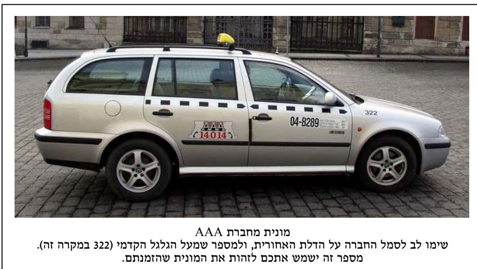
מונית מחברת AAA שימו לב לסמל החברה על הדלת האחורית, ולמספר שמעל הגלגל הקדמי (322 במקרה זה). מספר זה ישמש אתכם לזהות את המונית שהזמנתם.

אנו ממליצים על חברת AAA, שהיא חברת המוניות הגדולה ביותר בפראג. מספר הטלפון שלהם הוא: 14014 מכל טלפון. המרכזניות דוברות אנגלית. הזדהו בשמכם וציינו את שם הרחוב ומספר הבית שלידו אתם נמצאים – או כל אובייקט משמעותי אחר, כמו שדה התעופה לדוגמה. המרכזנית תמסור לכם הסבר על המקום שבו תחכה לכם המונית וגם את מספר המונית. לכל מונית בחברה זו יש מספר מיוחד בן שלוש או ארבע ספרות המודבק